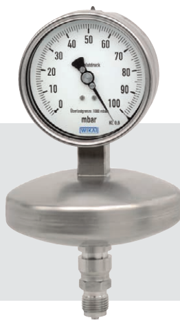
Typ 532.51 – 532.54