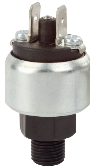
OEM-Kompaktdruckschalter, Miniaturbauweise, Typ PSM04