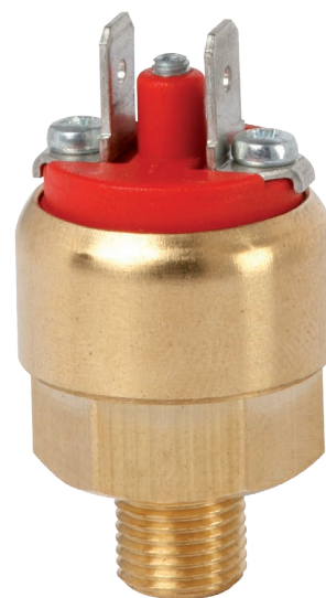
Pressostato compatto OEM, versione miniaturizzata, esecuzione in ottone, modello PSM05